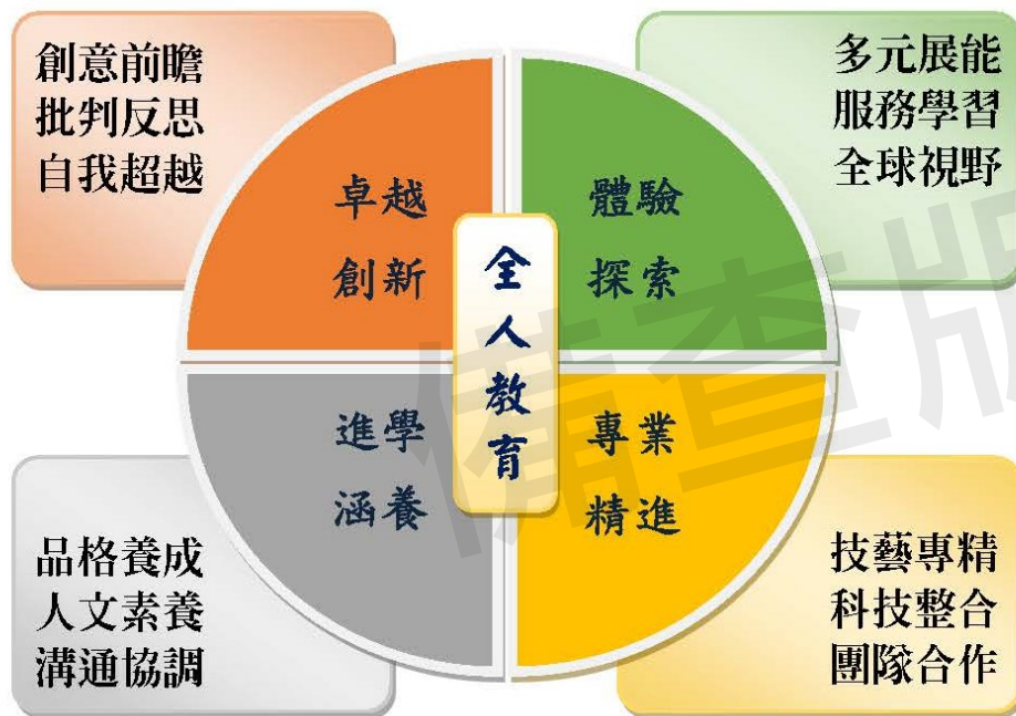
嘉義市私立興華高中 - 學生圖像